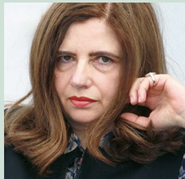
Sibylle Lewitscharoff (1954–2023) war eine bekannte deutsche Schriftstellerin. Der Text, den sie vor ihrem Tod reflecture zur Verfügung gestellt hat, ist leicht gekürzt, wiedergegeben.