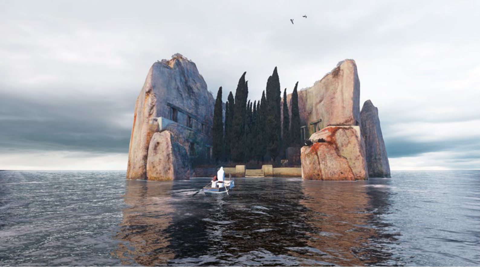
Arnold Böcklin: Die Toteninsel

Krankenlager vernahm. Sie kündigte ihm und der Öffentlichkeit den eingetretenen Tod eines Mitbürgers an. Die spontane Reaktion ist zu fragen, «wem die Stunde geschlagen hat» (eine Formulierung, die Ernest Hemingway für seinen gleichnamigen Roman übernahm). Dem Bedürfnis nach Information, dem wir heutzutage beim Lesen der Todesanzeigen nachgehen, hält Donne entgegen: «...und darum verlange nie zu wissen, wem die Stunde schlägt; sie schlägt dir selbst.» Die Totenglocke, die für einen Mitmenschen ertönt, konfrontiert mit der eigenen Sterblichkeit. Die letzte Stunde wird einmal für jeden schlagen, auch für mich selbst. Ja mehr - die Totenglocke, die für einen anderen erschallt, ruft auch mich selbst, und zwar zum bewussten Leben im Hier und Jetzt, das jederzeit ein Ende finden kann.