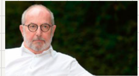
Thomas Hürlimann, Schriftsteller, NZZ a.S. 20.12.20

Vergessen wir nicht: Eine Gesellschaft ohne Werte ist wertlos. Wir können die Frage, wer wir sind, nur mit dem Rückgriff auf eine jüdisch-griechisch-christliche Kultur beantworten.