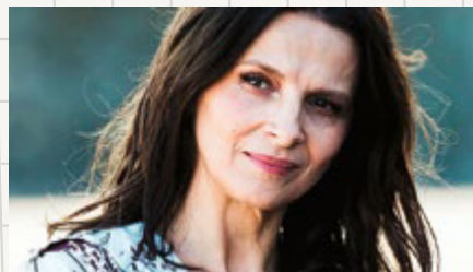
Juliette Binoche, Schauspielerin, TA 2.10.2020

Ich glaube, wir brauchen einen inneren Umsturz, einen Wandel in unserem Inneren (...) Wir befinden uns in einer Übergangsphase, das Leben wird härter, besonders für die Ärmsten. Wir müssen aufhören, über unser kleines Leben nachzudenken, stattdessen uns darum kümmern, was auf dem Planeten vor sich geht. Wir müssen die Leute um uns herum bewusster wahrnehmen und uns weniger egoistisch verhalten.