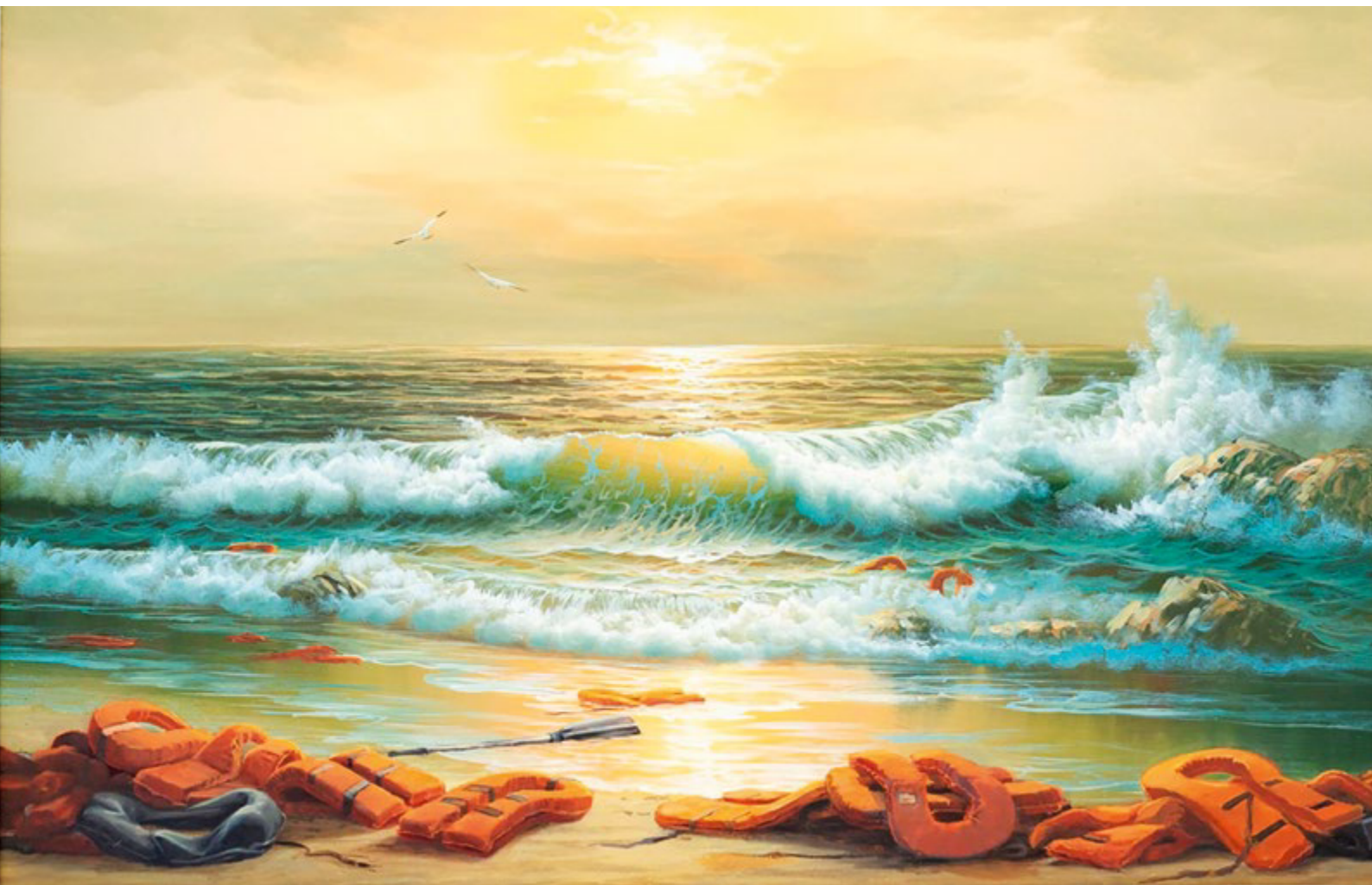
Banksy: Mediterranean Sea View 2017