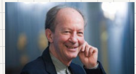
Giorgio Agamben, italienischer Philosoph, NZZ 28.10.2020

Alt werden: nur noch in den Wurzeln wachsen, nicht mehr in den Zweigen. Sich in Wurzeln vertiefen, ohne Blüten und Blätter. Oder eher wie ein trunkener Schmetterling, der über das Erlebte hinwegflattert. Es gibt immer noch Äste und Blumen im Vergangenen. Und immer noch lässt sich Honig daraus machen.