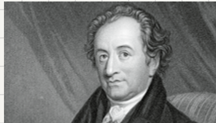
Johann W. Goethe, Wahlverwandtschaften

So setzen alle zusammen, ein jeder auf seine Weise, das tägliche Leben fort, mit und ohne Nachdenken, alles scheint seinen gewöhnlichen Gang zu gehen, sowie man auch in ungeheuren Fällen, wo alles auf dem Spiel steht, noch immer so fortlebt, als wenn von nichts die Rede gewesen wäre.