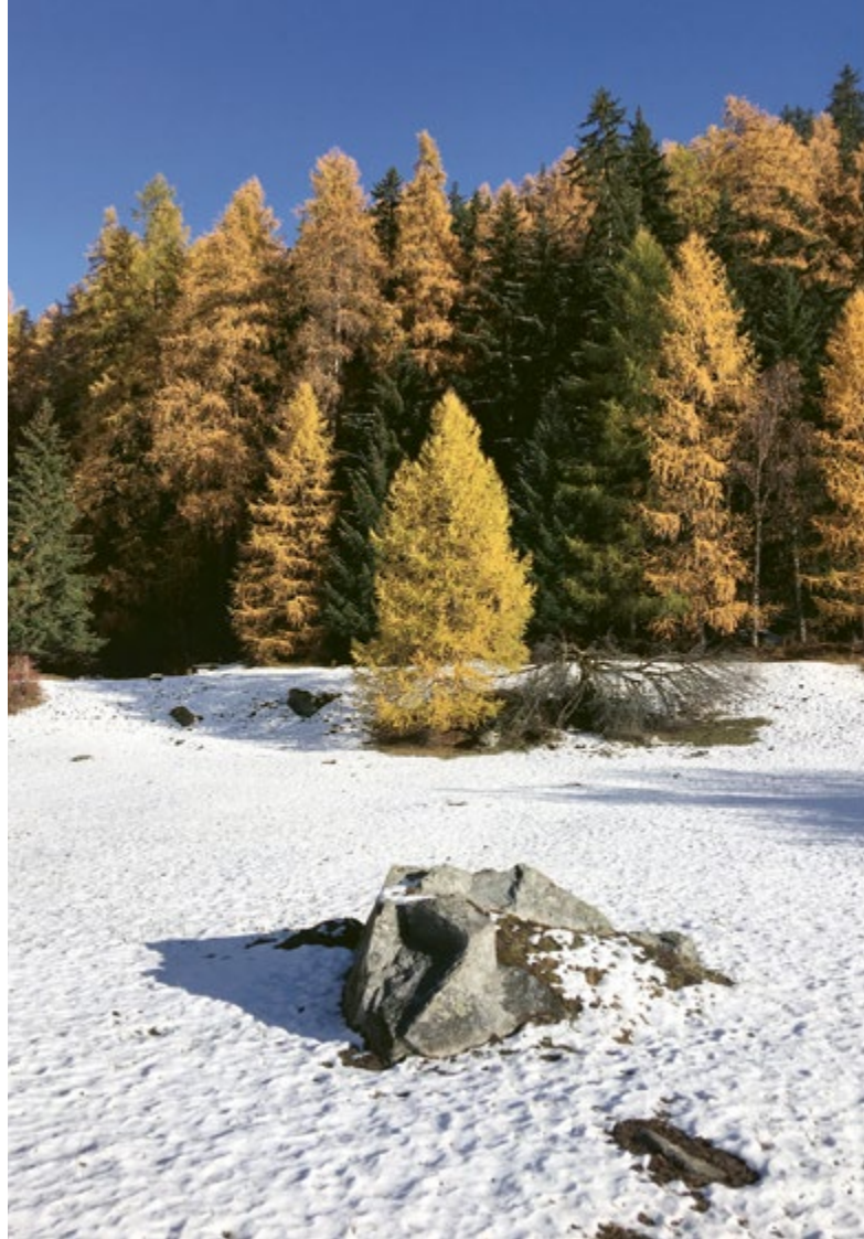
Der erste Schnee bei Lavin (Engadin)

Irgendwo habe ich einmal gelesen, dass sich die Landschaften, durch die wir gehen, in unser Gesicht schreiben. Man sehe sie dort abgebildet, mit ihren Fur-